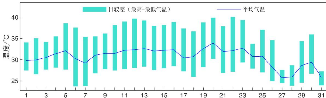
2022 年 8 月鄞州国家基本气象站日平均气温和气温日较差变化图

全市月平均气温 30.6^{\circ}\text{C} ，较常年偏高 2.6^{\circ}\text{C} ，破历史同期最高纪录；上旬 30.8^{\circ}\text{C} ，偏高 2.1^{\circ}\text{C} ，破历史同期最高纪录；中旬 31.9^{\circ}\text{C} ，偏高 3.7^{\circ}\text{C} ，破历史同期最高纪录；下旬 29.3^{\circ}\text{C} ，偏高 1.9^{\circ}\text{C} 。